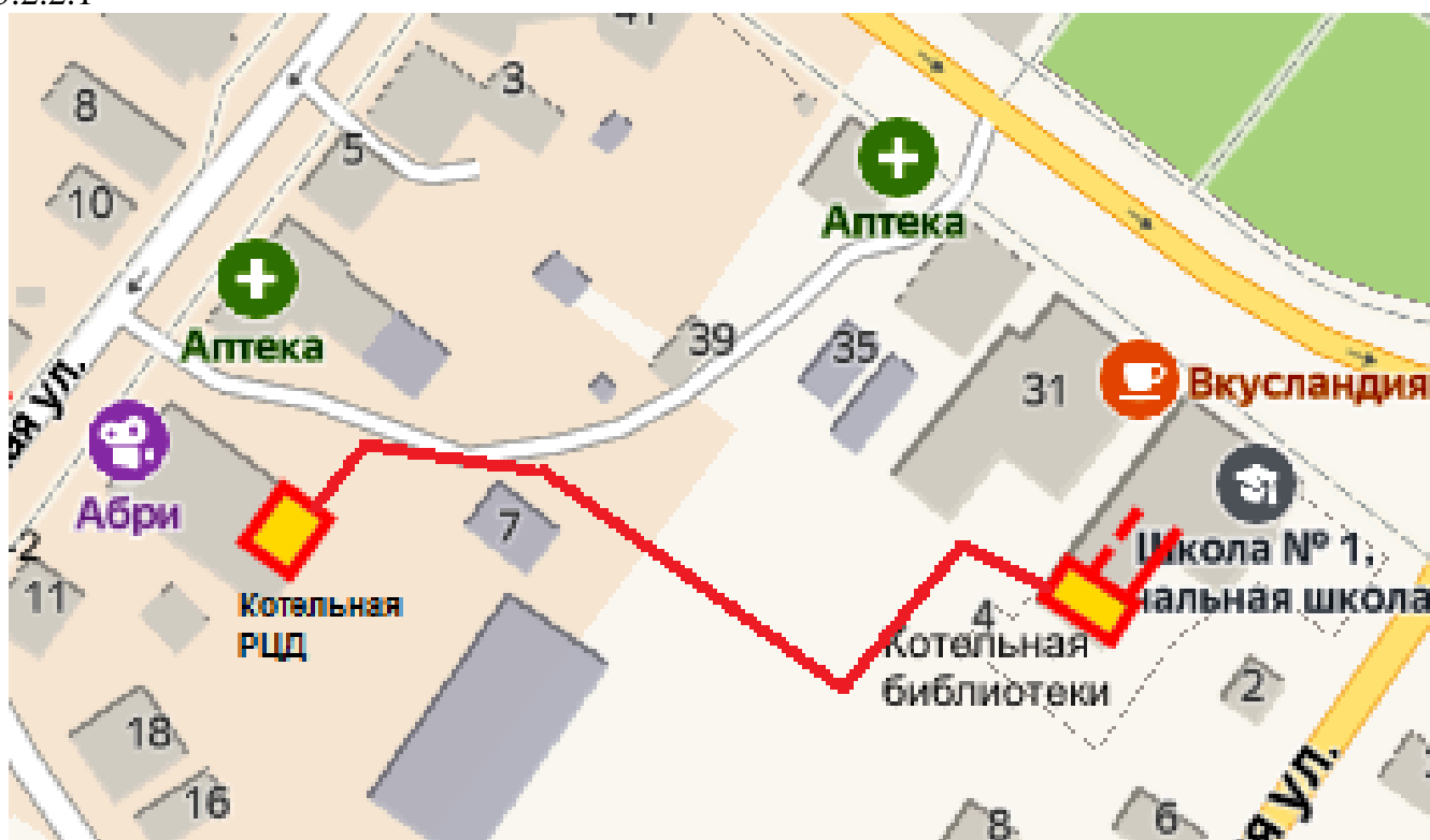
Рисунок 5.2.2.1 — Схема прокладки соединительного участка теплосети РЦД - библиотека В настоящее время установленная мощность котельной РЦД составляет 0,48 Гкал/ч, а подключенная тепловая нагрузка – 0,1 Гкал/ч. Имеющийся резерв тепловой мощности 0,38 Гкал/ч.

В качестве трубопроводов целесообразно использовать стальные предварительно изолированные трубы в ППУ-изоляции. Способ прокладки – бесканальный. Переход через проезжую часть выполнить в стальной гильзе. Схема тепловых сетей приведена на рисунке 5.2.2.1