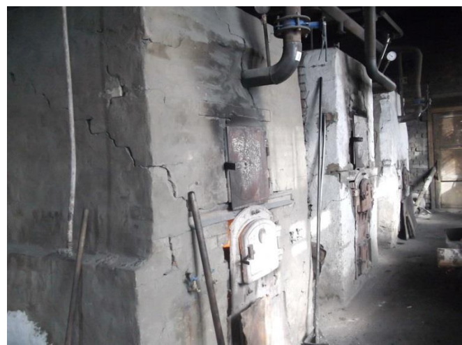
Рисунок 1.2.4 – Котлы котельной 13 квартала