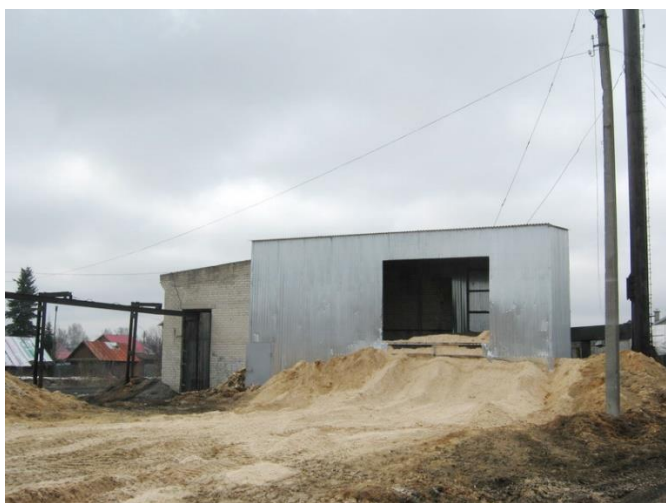
Рисунок 1.2.9 – Здание котельной бани