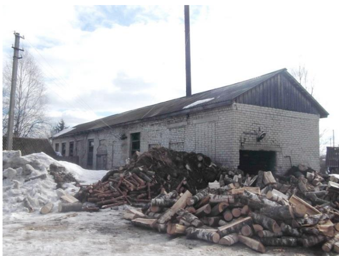
Рисунок 1.2.5 – Здание котельной 27 квартала