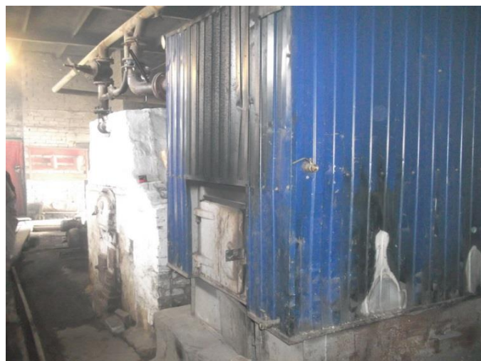
Рисунок 1.2.6 – Котлы котельной 27 квартала