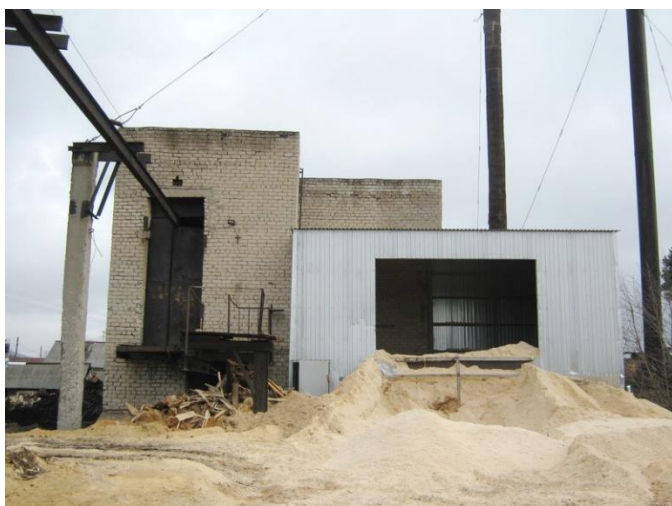
Рисунок 1.2.11 – Здание котельной 21 квартала