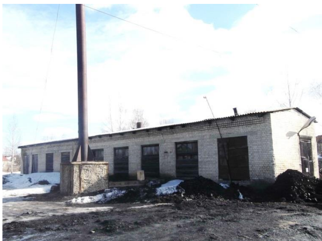
Рисунок 1.2.3 – Здание котельной 13 квартала