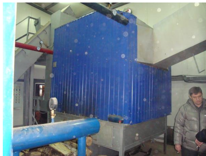
Рисунок 1.2.2 – Котел в котельной 23 квартала