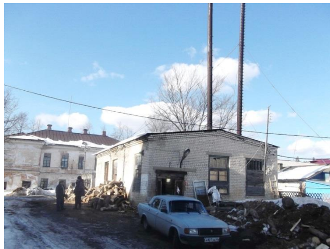
Рисунок 1.2.8 – Котельная школы №1