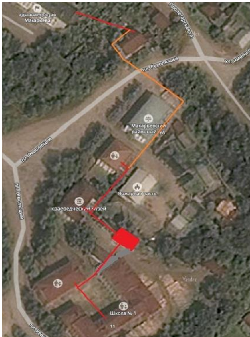
Рисунок 5.2.3.1 — Схема прокладки соединительного участка теплосети школа №1 — здание администрации района

В настоящее время установленная мощность котельной школы №1 составляет 1,06 Гкал/ч, а подключенная тепловая нагрузка – 0,4 Гкал/ч. Имеющийся резерв тепловой мощности 0,66 Гкал/ч. Однако старые котлы Универсал-6 и ТВН-1 нуждаются в замене. Является целесообразным на этой котельной установить новый щеповой котел КВТ-0,5.