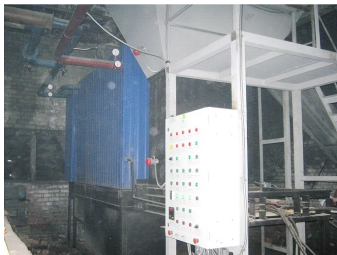
Рисунок 1.2.10 – Котел КВМ-1,16 в котельной бани