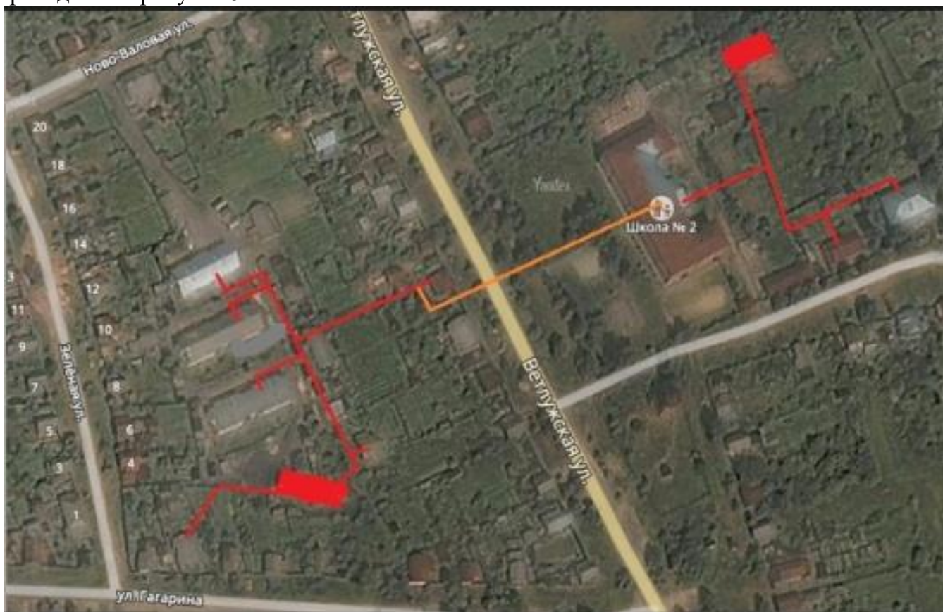
Рисунок 5.2.1 — Схема прокладки соединительного участка теплосети 27 квартал – школа №2

В качестве трубопроводов целесообразно использовать стальные предварительно изолированные трубы в ППУ- изоляции. Способ прокладки – бесканальный. Переход через проезжую часть улицы выполнить в стальной гильзе. Схема тепловых сетей 27 квартала приведена на рисунке 5.2.1.