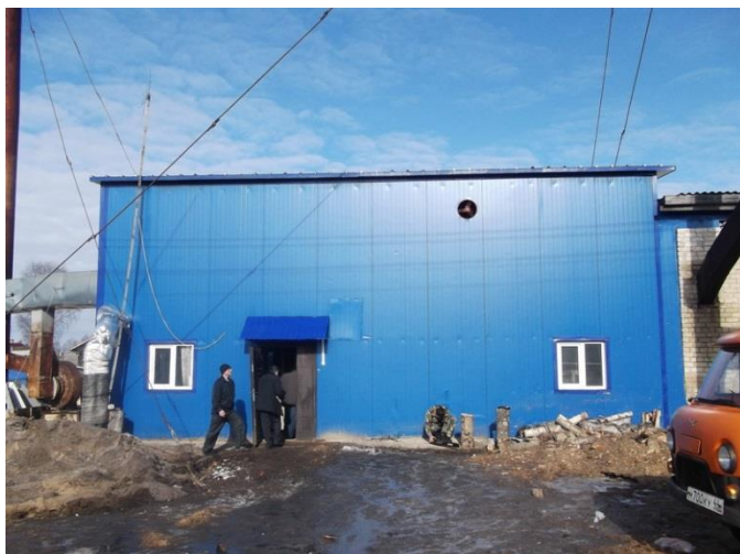
Рисунок 1.2.1 – Здание котельной 23 квартала