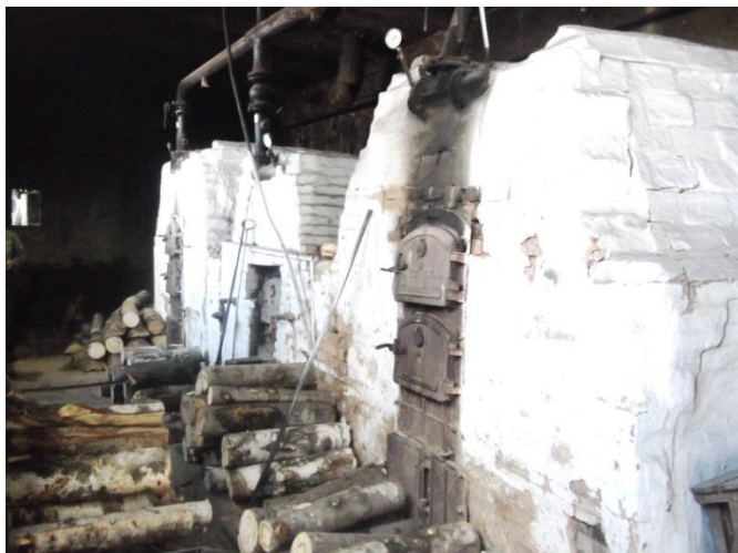
Рисунок 1.2.7 – Котлы в котельной Лесторга