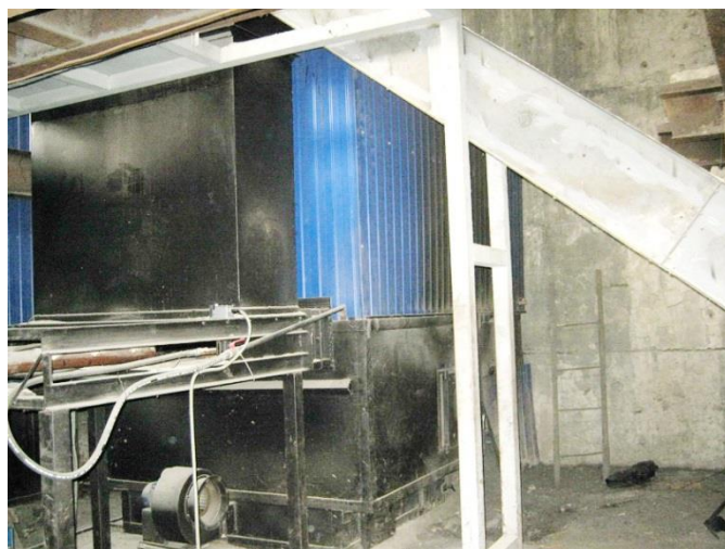
Рисунок 1.2.12 – Котел КВМ-2,0 в котельной 21 квартала